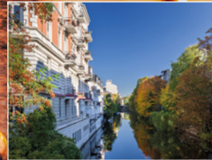
Isebekkanal in Eppendorf