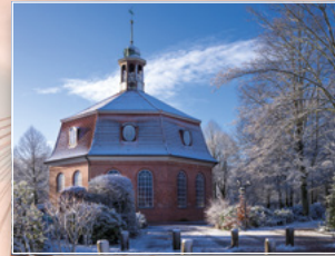
Kirche am Markt