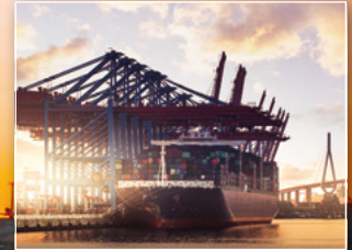
Containerschiff im Hafen