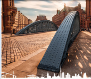
Historische Brücke in der Speicherstadt

Inh. Apotheker Max Mustermann Musterstraße 1 • 12345 Musterstadt Telefon 0123 45678