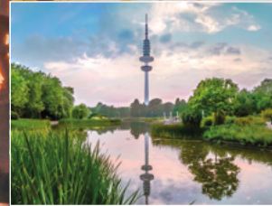
Planten un Blumen