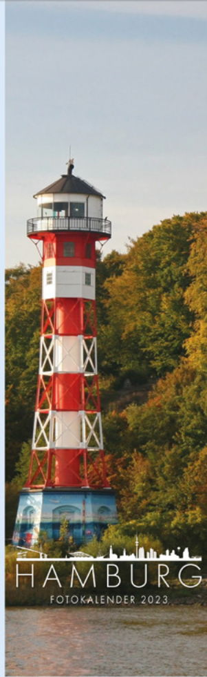
B-Format 14,3 x 48,5 cm

Inh. Apotheker Max Mustermann Musterstraße 1 • 12345 Musterstadt Telefon 0123 45678