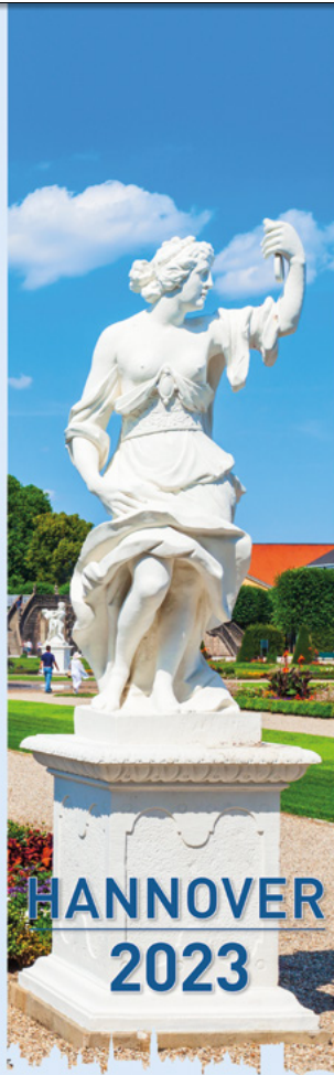
B-Format 14,3 x 48,5 cm