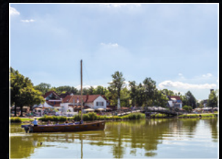
Steinhude am Steinhuder Meer