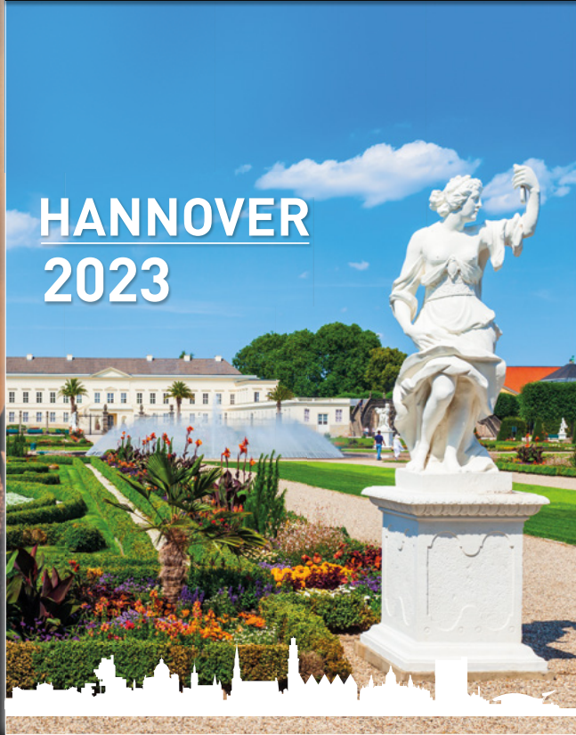
XL-Format 24 x 36 cm

Inh. Apotheker Max Mustermann Musterstraße 1 • 12345 Musterstadt • Telefon 0123 45678