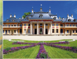
Schloss Pillnitz, Dresden