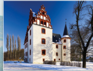
Schloss Netzschkau bei Mylau

15. Mariä Himmelfahrt