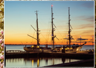
Marineschiff Gorch Fock in Bremerhaven