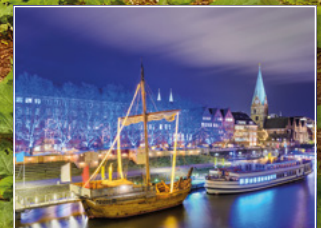
Weihnachtsmarkt an der Schlachte