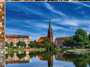
Holzhafen und Christuskirche in Bremerhaven