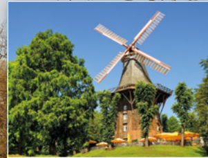
Mühle am Wall