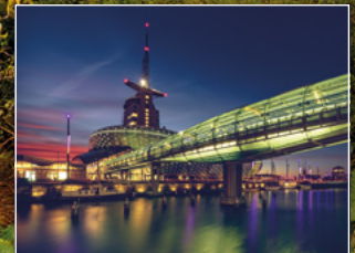
Blaue Stunde in Bremerhaven