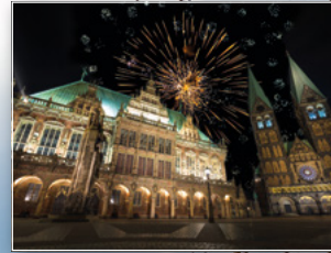
Silvesterfeuerwerk über dem Rathaus