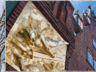
Lichtbringer an der Böttcherstraße