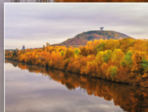
Halde Duhamel mit Saarpolygon