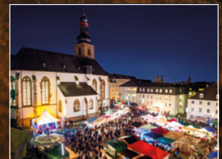
Saarbrücker Weihnachtsmarkt an der Schlosskirche