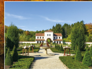
Römische Villa Borg