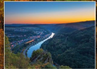
Blick ins Saartal