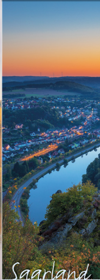
B-Format 14,3 x 48,5 cm